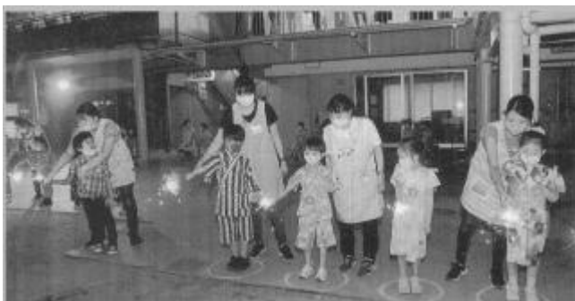
△ 手持ち花火も楽しみました。

夏休み前の夕刻、幼稚園に集まった年長児は、盆踊りや夜店などを楽しみ、最後に先生たちの用意した打ち上げ花火や吹き上げ花火を見たり、一人ずつ手持ちの花火を持って、夏の思い出を作りました。保護者の皆さんも離れた所から応援して下さいました。