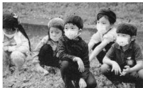
△マスクに大分慣れました。

昨年、コロナ感染予防のため様々な工夫をして保育を行って来ました。手洗い・うがいの徹底はもとより、間隔をとって活動したり、だまってバラバラに昼食をとったり、行事にも大幅な見直しが必要でした。子どもたちもがんばってコロナに耐えています。一日も早い終息宣言を待っています。