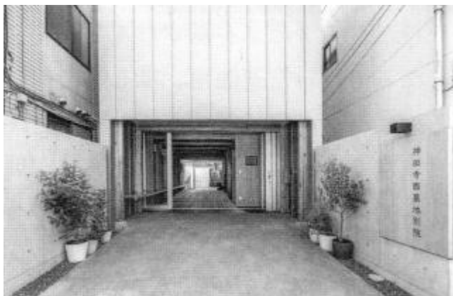
△ 正面入口 車が1台とめられます。

前号でもお伝えしたように、昨年7月下旬、西墓地隣地に新しく別院が完成しました。木造2階建て／1階・2階とも約57㎡で、1階は休憩所とトイレ、2階は礼拝室になっています。檀信徒の皆様には、たくさんのご協力を頂き（志納金総額:19,603,000円）厚く御礼申し上げます。これまで休む所もなかった西墓地利用の皆様には、念願の施設として1階でしばらくお話しされたり、2階の仏堂で法要をされたりと、活発な利用が始まっています。