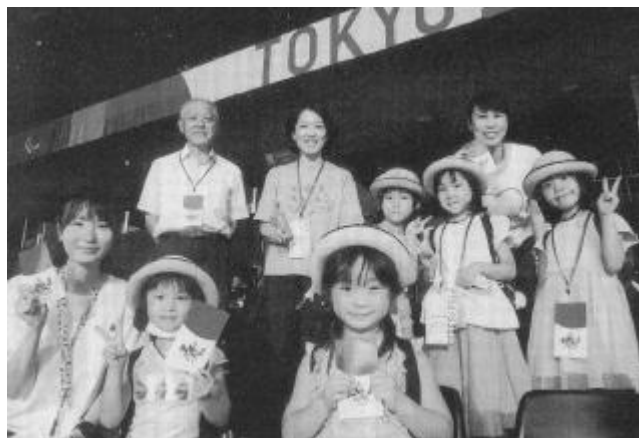
△ パラリンピック会場で

ほとんどの方がテレビ観戦だった大会に、短い時間ですが実際に参加し、応援できたことは貴重な体験でした。直前のPCR検査や熱中症対策の備品の配布など、周到な準備をして下さった東京都の皆さんに、厚く御礼申し上げます。